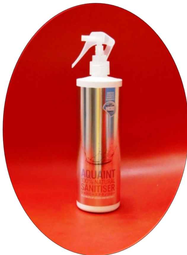
アクアシモのEU&北米版 “AQUAINT”