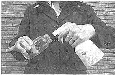
5、6回の噴霧で哺乳瓶を除菌できる

微酸性電解水は希塩酸が誤飲しても問題ないとを電気分解することで発いう。スプレー容器で微酸性電解水を噴霧し、哺乳瓶やアレルギーを引き