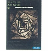
REALITY LAB 再生・再創造展

資源・環境の今後を考え、素材開発から調査・研究を行うプロジェクトの成果として、再生・再創造をテーマにした132 5.ISSEY MIYAKEの衣服と陰翳 IN-EIという照明器具を発表。