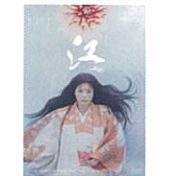
NHK大河ドラマ「江～戦たちの戦国」ポスター

博報堂を経て、goen設立。広告、ミュージシャンのアートワーク、保育園のアートディレクションなど、“縁”があるものの全てにおいて活動。最新作にNHK連続ドラマ「てっぱん」のオープニング。近著に「うたう作品集」。