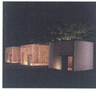
交遊 想庵 行庵

1943年横浜生まれ。桑沢デザイン研究所所長。毎日デザイン賞、芸術選奨文部大臣賞等受賞。紫綬褒章受章。世界各国での講演、国際コンペの審査、展覧会、デザイン企画のディレクションなど、日本を代表するデザイナー。