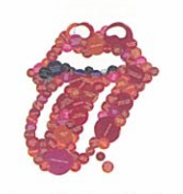
Artwork for The Rolling Stones Official T-shirt

アートディレクター、グラフィックデザイナー／ Art Director, Graphic Designer