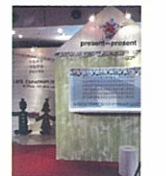
福岡IMS Christmas 2010「つながる つながる クリスマス」美術

1975年生まれ。空間演出のアートワーク・家具・店舗内装等、専門とする木工の他、様々な素材を使い素材感を生かした造形物の世界を作り出すことを得意とする。「動物園で、森本千絵展」では、小屋・動物等のオブジェの制作を担当。