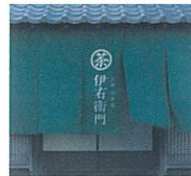
サントリー「伊右衛門」

1961年生まれ。1985年多摩美術大学卒業後、博報堂入社。2003年戦略から広告までトータルにブランディングを手がける(株)HAKUHODO DESIGNを設立。主な仕事に、サントリー「伊右衛門」資生堂「企業広告」など。