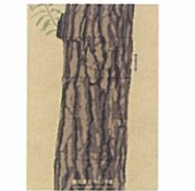
無印良品キャンプ場

松永真デザイン事務所を経て、95年新村デザイン事務所設立。主な仕事に資生堂・無印良品・エスエス製菓など。JAGDA新人賞、ニューヨークADC銀賞、ブルノ国際デザインビエンナーレ金賞、東京ADCなど受賞。