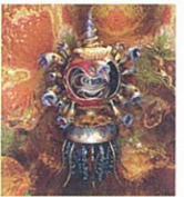
Ficco 宇宙探査型多層構造魚高2mの樹脂製オブジェ

CGアーティスト、東京大学大学院情報学環教授／ CG Artist, Professor, The University of Tokyo